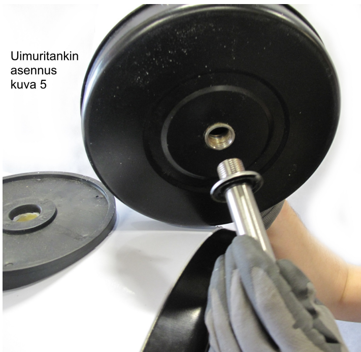
Uimuritankin asennus kuva 5