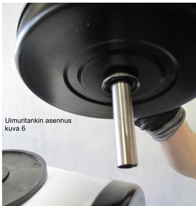
Uimuritankin asennus kuva 6