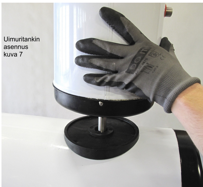
Uimuritankin asennus kuva 7