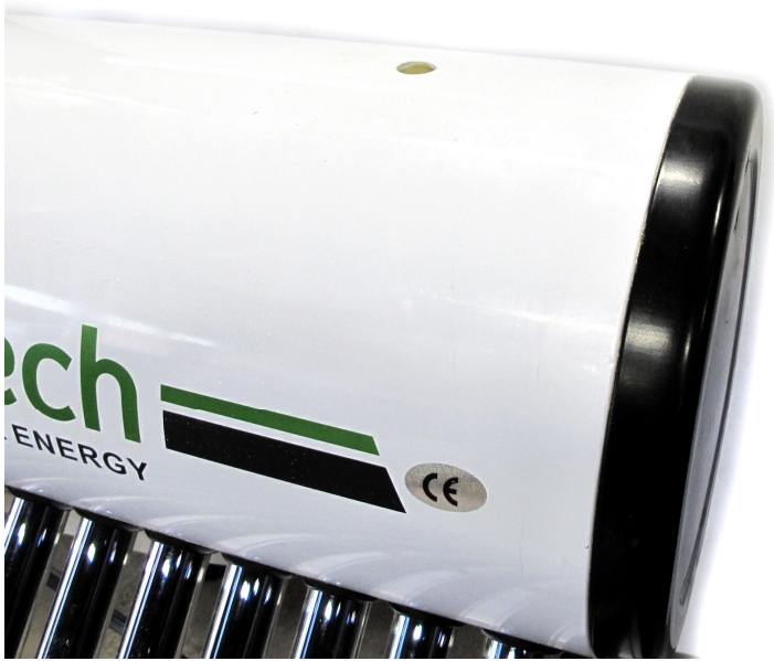
Uimuritankin asennus kuva 1