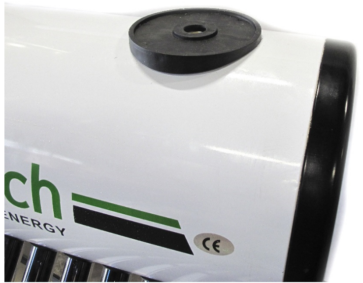
Uimuritankin asennus kuva 2