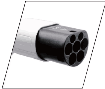
Soveltuu useimpiin EV-malleihin