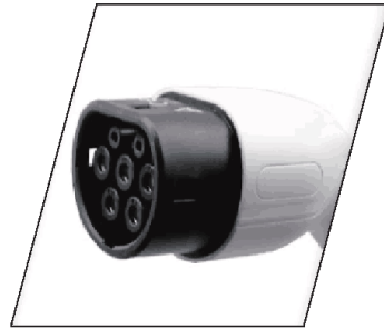
7-reikäinen sylinterimäinen turvapistorasia